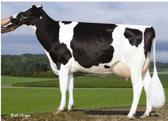
SANDY-VALLEY PLANE SAPPHIRE FIFTH DAM